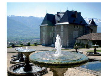
Jardins et château du Touvet