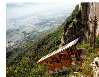
Funiculaire de St Hilaire du Touvet